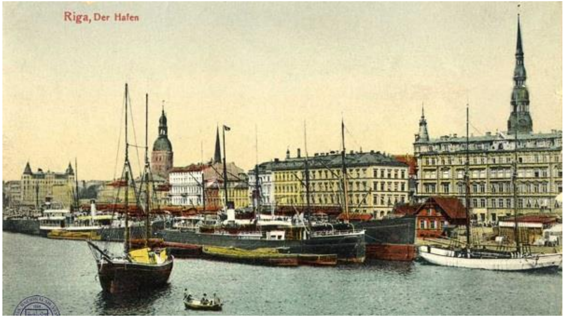
Riga, Der Hafen